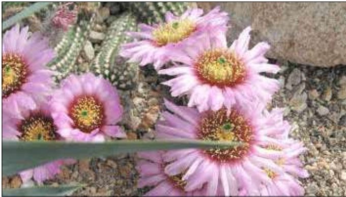
Echinocereus reichenbachii 2